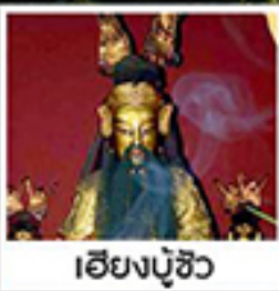
เอียงบู๊ซิว