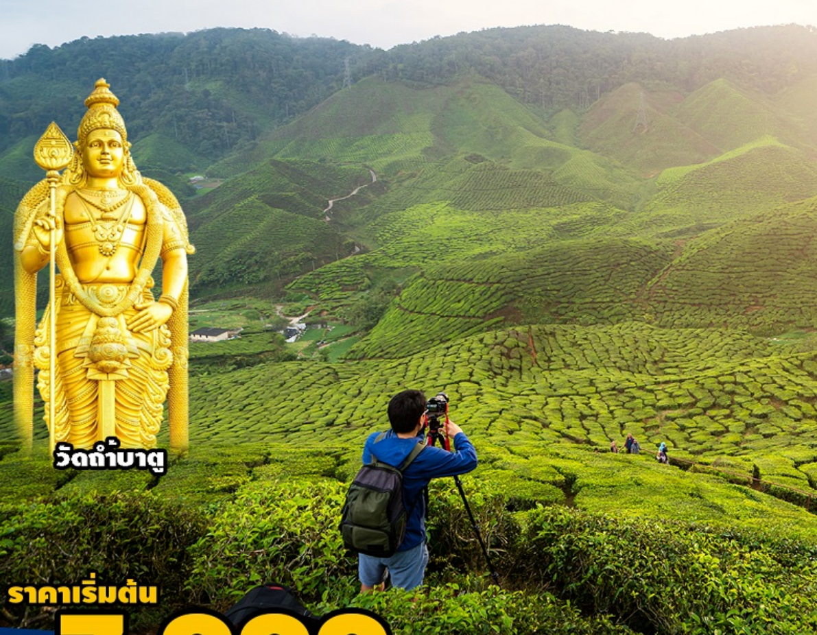
วัดท่ามาตุ

ปุตราจายา-คาเมร่อน-เก็นติ้ง-กัวลาลู 3วัน2 คืน โดยสายการบิน มาเลเซีย แอร์ไลน์ (MH)