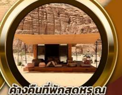
ค้ำคืนที่พักสุดหรู ณ Habitat AlUla 2 คืน

พิเศษ!! รับประทานอาหาร ณ ภัตตาคารอาหารไทย สุดหรูและไฮโซ @Saffron Banyan Tree AlUla