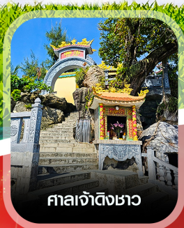
ศาลเจ้าดิ้งซา