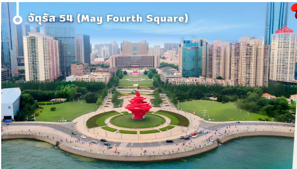
จัตุรัส 54 (May Fourth Square)

นำท่านเดินทางสู่ จัตุรัส 54 แลนด์มาร์กสำคัญและสัญลักษณ์ประจำเมืองชิงเต่า ตั้งอยู่ริมอ่าวฝูซาน โดดเด่นด้วยประติมากรรมสีแดงขนาดยักษ์ "สายลมแห่งเดือนพฤษภาคม" ซึ่งสร้างขึ้นเพื่อรำลึกถึงขบวนการ 4 พฤษภาคม อันเป็นเหตุการณ์สำคัญในประวัติศาสตร์จีน นักท่องเที่ยวสามารถเดินเล่นริมทะเล ชมวิวเมืองสมัยใหม่ และสัมผัสบรรยากาศอันสวยงามของอ่าวชิงเต่า โดยเฉพาะในช่วงค่ำที่มีการเปิดไฟประดับทั่วบริเวณ ถือเป็นจุดชมวิวและถ่ายภาพที่มีชื่อเสียงที่สุดแห่งหนึ่งของเมืองชิงเต่า