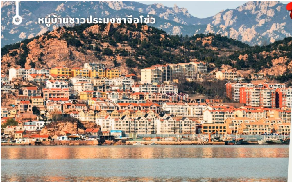
หมู่บ้านชาวประมงซาโจว