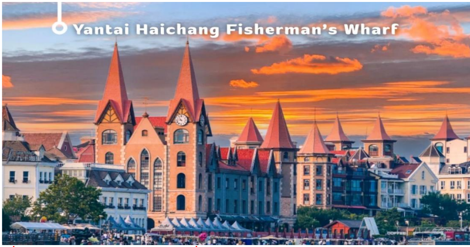
Yantai Haichang Fisherman's Wharf