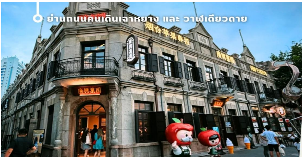
ย่านถนนคนเดินเฉาหยาง และ วาฬเดี่ยวดาย

นำท่านเช็คอินย่านฮิต ของเมืองเยินไถ่ ย่านถนนคนเดินเฉาหยาง (Chaoyang Walking Street) ใจกลางเมืองเยินไถ่ ย่านเก่าแก่ที่สะท้อนเสน่ห์ของเมืองผ่านสถาปัตยกรรมผสมผสานระหว่างยุโรปและจีนดั้งเดิม สร้างบรรยากาศคลาสสิกที่ยังคงความมีชีวิตชีวาในแบบร่วมสมัยตลอดเส้นทางถนนที่ทอดยาวประมาณ 400 เมตร รายล้อมด้วยร้านค้า คาเฟ่ ร้านอาหาร และสตรีทฟู้ดให้เลือกหลากหลาย เหมาะสำหรับการเดินชมเมือง ชิมอาหารท้องถิ่น และสัมผัสวิถีชีวิตยามค่ำคืนของชาวเยินไถ่ ท่ามกลางแสงไฟที่ประดับสวยงามทั่วทั้งย่าน กลายเป็นอีกหนึ่งจุดเช็คอินยอดนิยม และพาทุกท่านถ่ายภาพคู่กับ “วาฬเดี่ยวดาย” (Lonely Whale Landmark) แลนด์มาร์กศิลปะริมทะเลสุดโดดเด่นของเมืองชายฝั่ง โดดเด่นด้วยประติมากรรมรูปวาฬขนาดใหญ่ตั้งอยู่กลางพื้นที่เปิดโล่งริมทะเล สร้างภาพจำอันแปลกตาท่ามกลางบรรยากาศธรรมชาติอันกว้างไกล สัมผัสความงดงามของวิวัฒนาการและสายลมทะเลที่พัดผ่านตลอดแนวชายฝั่ง พร้อมเก็บภาพเช็คอินมุมไฮไลท์ที่ผสมผสานงานศิลปะร่วมสมัยเข้ากับธรรมชาติได้อย่างลงตัว เป็นอีกหนึ่งจุดหมายที่เพิ่มสีสันให้การเดินทางน่าประทับใจยิ่งขึ้น