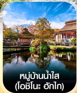
หมู่บ้านน้ำใส (โอะชิโนะ อักโท)

✈ คอนเฟิร์ม ออกเดินทาง ทุกพีเรียด 2 ท่านขึ้นไป