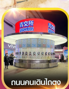
ถนนคนเดินโกตง