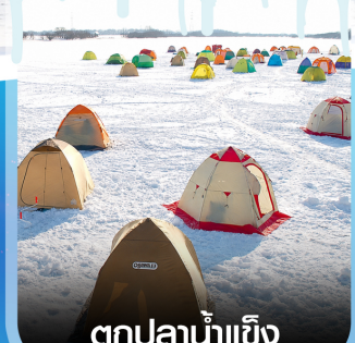
ตกปลาน้ำแข็ง