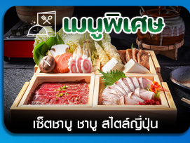
เช็ตเตาบุ ซาซู สีสต์ญี่ปุ่น

ชิบิโร-หมู่บ้านน้ำแข็ง-กระเช้าอุไค-ลานสกีซึกิไซ-สวนสัตว์อาซาฮิยาม่า-โอตารุ-โรงงานช็อกโกแลต-ซ้อปปิงทานุกิโคจิ-เที่ยวเต็มไม่มีอิสระ