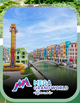
ไฮไลท์ทั้งหมด

✈️ คอนเฟิร์มออกเดินทาง ทุกปีเรียด 2 ท่านขึ้นไป