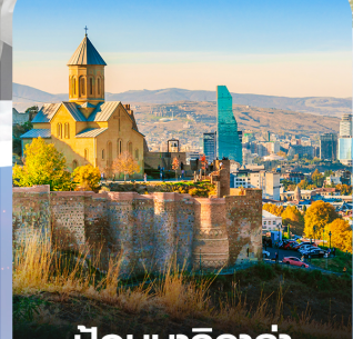
ป้อมนาริกาล่า