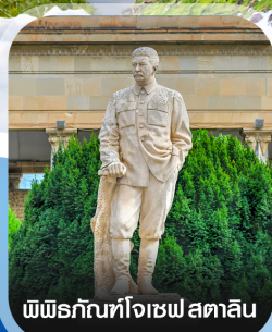
พิพิธภัณฑ์โจเซฟ สตาลิน

✈️ คอนเฟิร์มออกเดินทาง ทุกพีเรียด 2 ท่านขึ้นไป