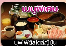
บุฟเฟ่ต์สไตล์ญี่ปุ่น

ซัปโปโร-ชมทุ่งดอกลาเวนเดอร์-โทมิตะฟาร์ม-ชิชิไซโนะโอกะ-น้ำตกชิราอิเกะ-บ่อน้ำสีฟ้า-อีสระะซ็อบบั้งเต็มวัน-ฟักออนเซน