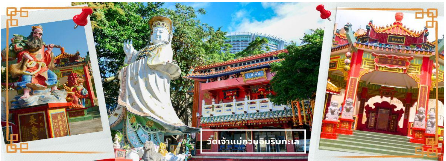
วัดเจ้าแม่กวนอิมริบททะเล

จากนั้นนำท่านเดินทางสู่ วัดเจ้าแม่กวนอิม อ่าวรีพัลส์เบย์ (REPULSE BAY) ตั้งอยู่ริมทะเล เป็นสถานที่ท่องเที่ยวสำคัญ สร้างขึ้นในปี ค.ศ.1993 วัดแห่งนี้ถูกสร้างขึ้นเพื่อคุ้มครองชาวประมงในการออกเรือไปหาปลา ซึ่งเป็นหนึ่งในวัดที่เก่าแก่ที่สุดของฮ่องกง บริเวณวัดจะมี เจ้าแม่กวนอิมองค์ใหญ่ ปางประทานพรตั้งอยู่ เป็นเทพที่ชาวฮ่องกงและคนจีนให้ความเคารพนับถือมากที่สุด สามารถขอพรได้ทุกเรื่อง วัดนี้เป็นที่นิยมมีนักท่องเที่ยวเดินทางมาขอพรกันมากมาย เพราะเชื่อในความศักดิ์สิทธิ์ และยังมีเจ้าแม่ทับทิม หรือเทพธิดาแห่งท้องทะเลองค์ใหญ่ ซึ่งคนฮ่องกง คนมาเก๊า และคนจีน ที่อยู่ริมทะเล ชาวประมง นักเดินเรือหรือผู้ที่เดินทางทางเรือเป็นประจำ จะนับถือเจ้าแม่ทับทิมเป็นอย่างมาก มีความเชื่อว่าเจ้าแม่ทับทิมจะปกป้องเราจากภัยอันตรายระหว่างการเดินทาง ภายในวัดยังมีเทพเจ้าและพระพุทธรูปต่างๆ ประดิษฐานไว้มากมายตามความเชื่อถือศรัทธา เช่น เทพเจ้าไฉชิงเอี้ย ไหว้ขอโชคลาภความมั่งคั่ง ความร่ำรวย, พระสังกัจจายน์โพธิสัตว์ เทพประทาน บุตร-ธิดา ไหว้อธิษฐานขอลูก, สะพานต่ออายุ (สะพานอายุยืน) สะพานสีแดงตั้งอยู่บนริมหาด สีแดงสด เชื่อกันว่า คนจีนเชื่อกันว่าหากเดินข้ามสะพานนี้ เราจะมีอายุยืนขึ้นอีก 3 วัน (3 วัน บนสวรรค์ = 3 ปี บนโลกมนุษย์) นั้นหมายความว่า ถ้าเราเดินข้ามสะพานนี้แล้ว จะมีอายุยืนยาวขึ้นอีก 3 ปี บนโลกมนุษย์, เทพเจ้าแห่งความรัก ไหว้ขอเนื้อคู่, ศาลา 8 เหลี่ยม เชื่อกันว่าเป็นจุดที่มีดวงจ้ายดีที่สุด ภายในศาลาแปดเหลี่ยม จุดกึ่งกลางของพื้นจะมีรูปแปดเหลี่ยม ให้เราไปยื่นขอพรจากตำแหน่งนี้เพื่อขอพลังจากสวรรค์ และอีกมากมายให้ท่านได้สักการะบูชา