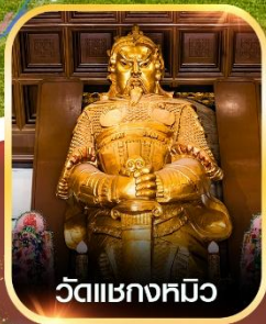
วัดแซงกหมิว

✈️ คอนเฟิร์ม ออกเดินทาง ทุกพีเรียด 2 ท่านขึ้นไป