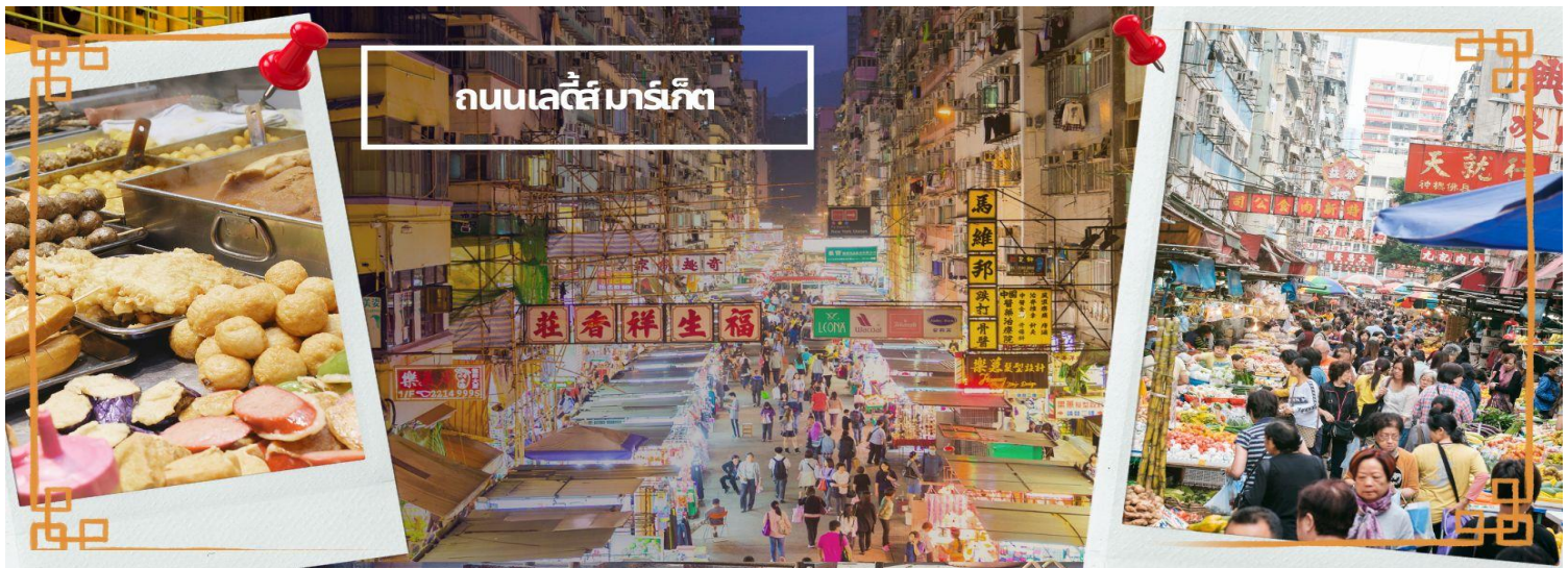
ถนนเลดี้มาร์เก็ต

นำท่านเดินทางเข้าสู่ที่พัก RAMADA GRAND HOTEL/BEST WESTERN PLUS HOTEL ★★★★★ หรือเทียบเท่า ★★★★★ หรือเทียบเท่า