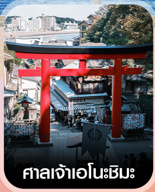
ศาลเจ้าเอโนะชิมะ