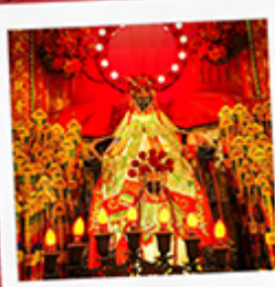
เจ้าแม่กวนอิมของฮ่า