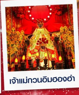
เจ้าแม่กวนอิมสองฮ่า