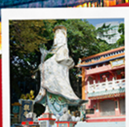
เจ้าแม่กวนอิมรัพลัสสมัย