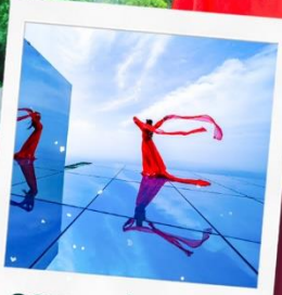
กระจกท้องฟ้า