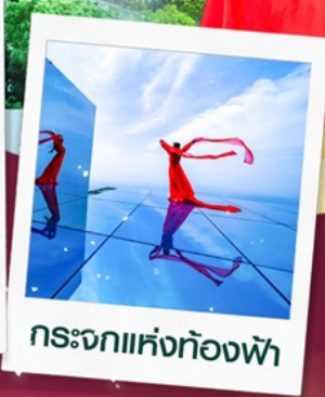
กระจกแห่งท้องฟ้า