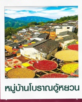
หมู่บ้านโบราณอู๋หยวน