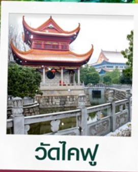
วัดโคฟู่