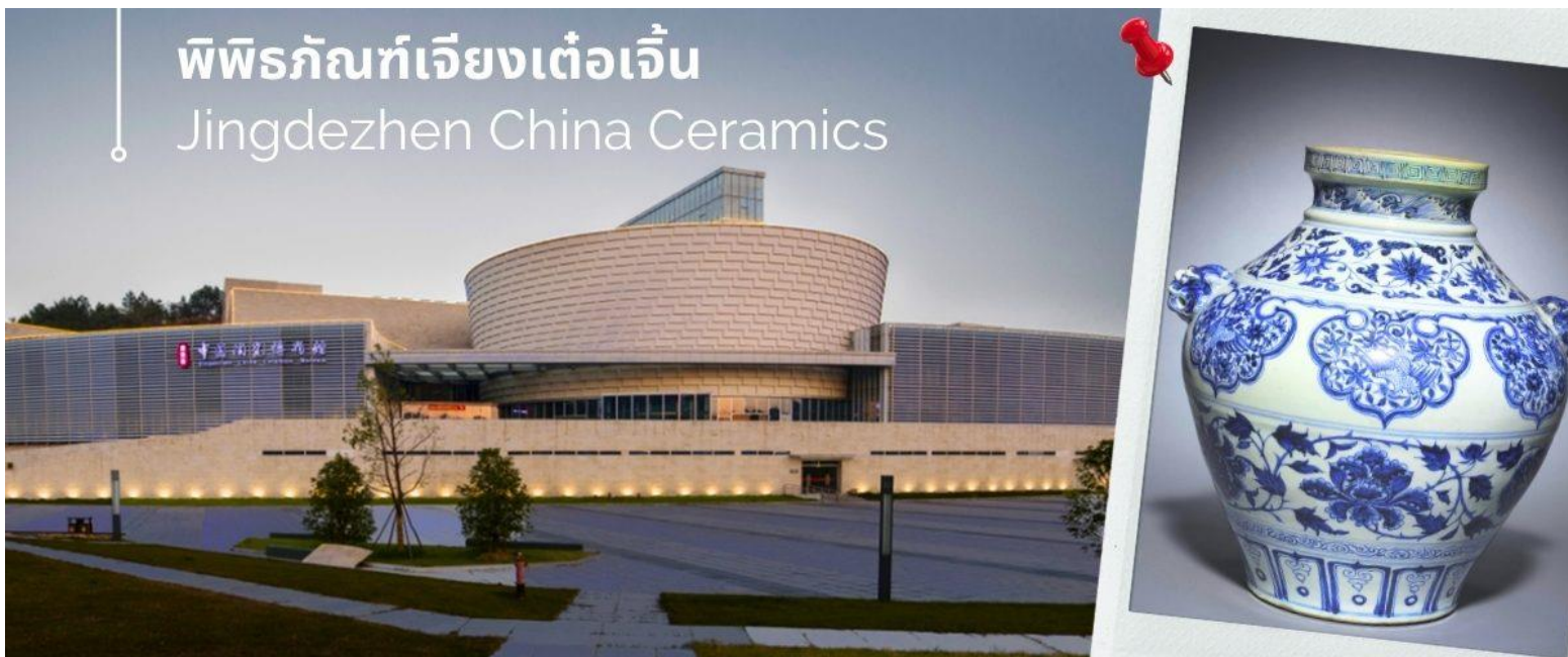
พิพิธภัณฑ์เจียงเต๋อเจิ้น Jingdezhen China Ceramics

นำท่านชม พิพิธภัณฑ์ Jingdezhen China Ceramics เดิมชื่อ Jingdezhen Ceramics Museum เป็นพิพิธภัณฑ์ศิลปะเซรามิกขนาดใหญ่แห่งแรกในจีน เนื้อหาในทรรศการในพิพิธภัณฑ์แบ่งออกเป็น “แผนกประวัติศาสตร์” “แผนกจีนใหม่” และห้องนิทรรศการพิเศษ เป็นที่รวบรวมผลงานเซรามิกที่มีชื่อเสียงจากยุคประวัติศาสตร์ที่แตกต่างกันมากกว่า 20,000 ชิ้น ตั้งแต่ยุคหินใหม่ ราชวงศ์ฮั่นและถัง รวมถึงโบราณวัตถุทางวัฒนธรรมอันล้ำค่าของชาติมากกว่า 500 ชิ้น ครอบคลุมประวัติศาสตร์พันปี