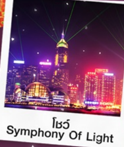
โชว์ Symphony Of Light