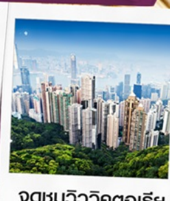
จุดชมวิวกทอเรีย