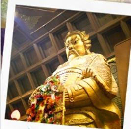
วัดเขากงหมิว