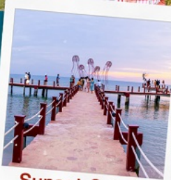
Sunset Sanato Beach Club