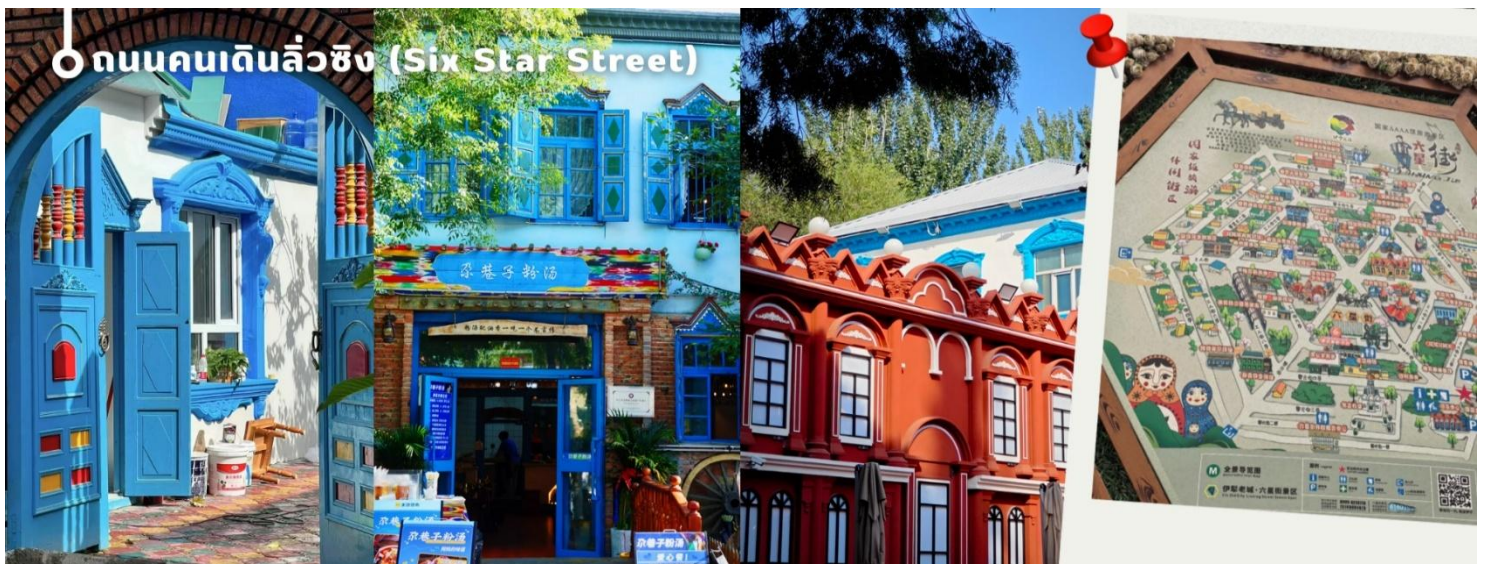
○ ถนนคนเดินลิวซิง (Six Star Street)

จากนั้นนำทุกท่านเพลิดเพลินกับ ถนนคนเดินลิวซิง (Six Star Street) แลนด์มาร์คสำคัญของเมืองอีหนิง สร้างขึ้นตั้งแต่ปี ค.ศ. 1934 โดยออกแบบเป็นผังรูปดาว 6 แฉก ภายในเต็มไปด้วยบ้านสไตล์ซินเจียงสีสดใส โดดเด่นด้วยผนังสีฟ้า หลังคาสีชมพู และสวนดอกไม้ที่สวยงาม ให้บรรยากาศราวกับเมืองในเทพนิยาย ที่นี่สะท้อนความหลากหลายทางวัฒนธรรมของชาวอุยกูร์ คาซัค หุย และรัสเซีย นักท่องเที่ยวสามารถชมการแสดงพื้นเมือง ฟังดนตรีซินเจียงจากหีบ