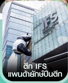
ตึก IFS แพนด้ายักษ์ป็นตึก