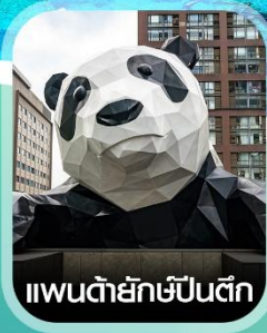
แพนด้ายักษ์ปิ่นตึก