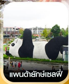
แพนด้ายักษ์เซลฟี

✈️ คอนเฟิร์ม ออกเดินทาง ✈️ ทุกพีเรียด 2 ท่านขึ้นไป