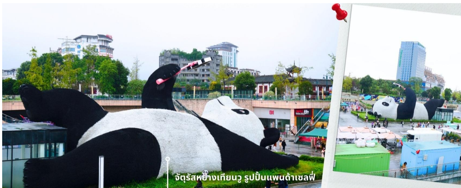
จัตุรัสหยางเทียนวู รูปปั้นแพนด้าเซลฟี่

นำท่านเที่ยวชม จัตุรัสหยางเทียนวู เป็นจุดเช็คอินที่สำคัญสำหรับคนที่มาเที่ยวที่ เมืองตูเจียงเยียน บริเวณจุดท่าข้าม อำเภอตูเจียงเยียน นครเฉิงตู ไฮไลท์ของจัตุรัสหยางเทียนวู คือ ประติมากรรม แพนด้ายักษ์ ที่กำลังนอนหงายท้อง ยื่นมือถือไม้เซลฟี่สีชมพู ซึ่งออกแบบโดยนักออกแบบชื่อดัง Florentijn Hofman รูปปั้นแพนด้า ยักษ์มีความยาว 26 เมตร กว้าง 11 เมตร สูง 12 เมตร และหนัก 130 ตัน แบบท่าทางสบายๆของแพนด้าที่สร้างความประทับใจและ รอยยิ้มให้กับผู้มาเยือนจัตุรัสหยางเทียนวู สามารถดึงดูดนักท่องเที่ยวได้เป็นจำนวนมากเลยทีเดียว เป็นการ แสดงออกด้วยภาษาทางศิลปะแบบหนึ่งที่สะท้อนชีวิตในท้องถิ่น มอบความรู้สึกสนิทสนมและมีความสุขกับผู้ชม อิสระเดินชมถ่ายภาพ รูปปั้นแพนด้าเซลฟี่ ตามอัธยาศัย ที่นี่เป็นจุดเช็คอินที่เหมาะสมสำหรับทุกเพศทุกวัย หากคุณ กำลังมองหาสถานที่ท่องเที่ยวใหม่ๆ ที่เต็มไปด้วย ความทรงจำดี จัตุรัสหยางเทียนวู คือคำตอบที่สมบูรณ์แบบ