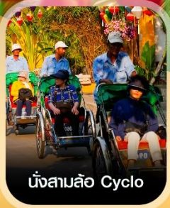
นั่งสามล้อ Cyclo