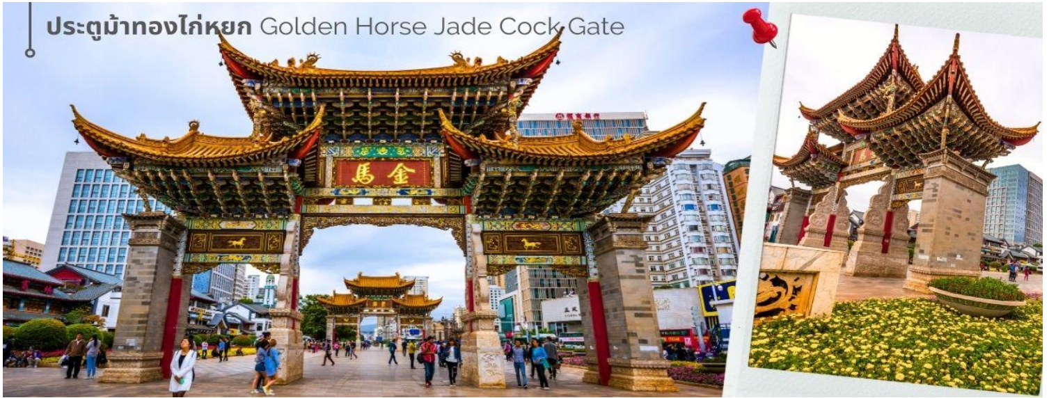
ประตูม้าทองไก่หยก Golden Horse Jade Cock Gate

ชม ซุ้มประตูม้าทอง และ ซุ้มประตูไก่หยก ซึ่งภาษาจีนเรียกว่าจินหม่า และปี้จี จึงเอาคำย่อ จินปี้ มาชานานนามถนน แห่งนี้ ซุ้มม้าทองและไก่หยก มีอายุร่วม 400 ปี สร้างขึ้นในสมัยราชวงศ์หมิง ในถนนย่านการค้าแห่งนี้ เป็นแหล่งเสื้อผ้า แปรนตร์เนมทั้งของจีนและต่างประเทศ รวมทั้งเครื่องประดับ อัญมณี ร้านเครื่องดื่ม และร้านขายของที่ระลึกมากมาย