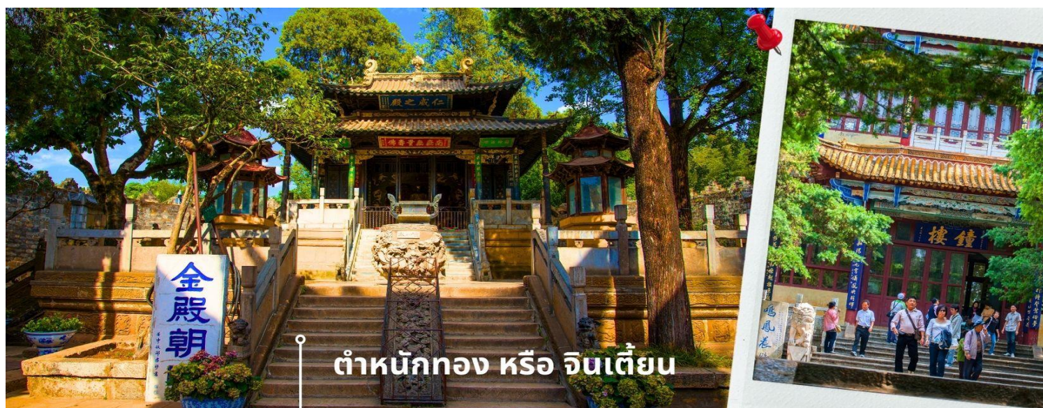
ท่าหนังกอง หรือ จินเตี้ยน