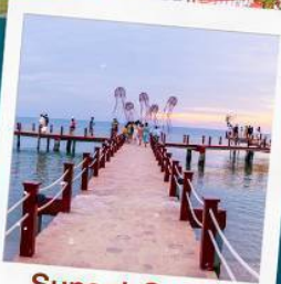
Sunset Sanato Beach Club