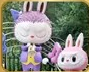
เที่ยวสวนสนุก