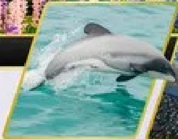
ล่องเรือชมปลาโลมา