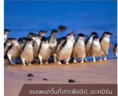
ชมเพนกวินที่เกาะฟาลิป, เมลเบิร์น