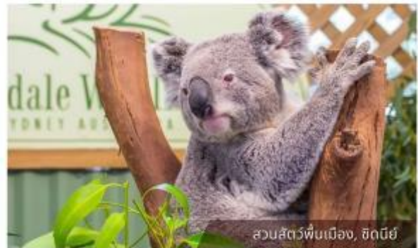
สวนสัตว์พื้นเมือง, ซิดนีย์