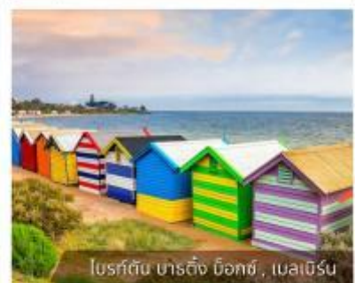
โบสถ์สีรุ้ง บาร์คิง น็อกซ์, เมลเบิร์น