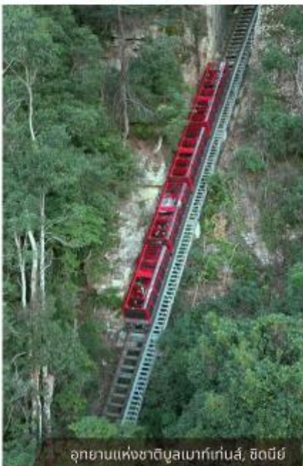
อุทยานแห่งชาติบลูเมาท์เทนส์, ซิดนีย์