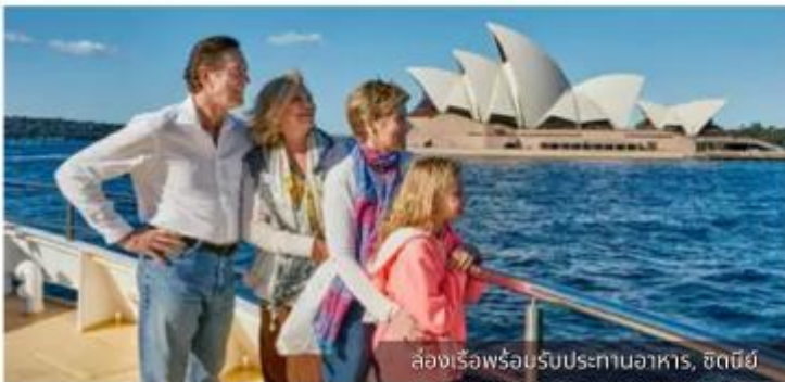
ล่องเรือพร้อมรับประทานอาหาร, ซิดนีย์