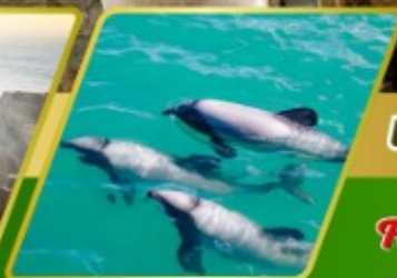
ล่องเรือชมโลมา