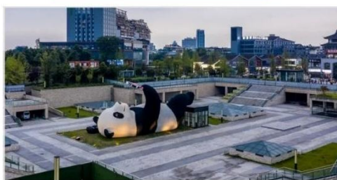
รูปปั้นแพนด้าเซลฟี