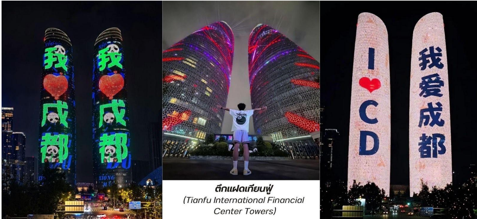
ตึกแฝดเทียนฟู่ (Tianfu International Financial Center Towers)

สมควรแก่เวลา นำท่านเดินทางกลับสู่โรงแรมที่พัก ระหว่างทางนำท่านแวะชมแสงสีถ่ายรูปลาด้านนอก ตึกแฝดเทียนฟู่ (Tianfu International Financial Center Towers, 天府双塔) สัญลักษณ์แห่งความทันสมัยและความก้าวหน้าของเมืองเจียงตู ตึกระฟ้าแฝดแห่งนี้ตั้งตระหง่านอยู่ใจกลางย่านการเงินแห่งใหม่ ตึกแฝดเทียนฟู่มีความสูงกว่า 220 เมตร แต่ละตึกมีดีไซน์ที่โฉบเฉี่ยวและเป็นเอกลักษณ์ โดยเฉพาะในยามค่ำคืน ตัวอาคารจะถูกประดับประดาด้วยไฟ LED ที่สว่างไสว ทำให้เกิดการแสดงแสงสีที่สวยงามตระการตา