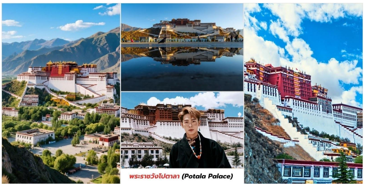
พระราชวังโปตาลา (Potala Palace)

นำท่านชม พระราชวังโปตาลา (Potala Palace, 布达拉宫) ตั้งอยู่กลางเมือง ลาซา (Lhasa) เมืองหลวงของเขตปกครองตนเองทิเบต (西藏自治区) ประเทศจีน เป็นพระราชวังเก่าแก่ที่ตั้งตระหง่านอยู่บนยอดเขา มารโปรี (Marpo Ri, 红山) สูงประมาณ 3,700 เมตรเหนือระดับน้ำทะเลและมีความสูงจากพื้นถึงยอดอาคารกว่า 117 เมตร ทำให้มองเห็นได้จากทุกมุมของเมืองพระราชวังโปตาลาดูยกย่องให้เป็น "หัวใจแห่งลาซา" และ "สัญลักษณ์