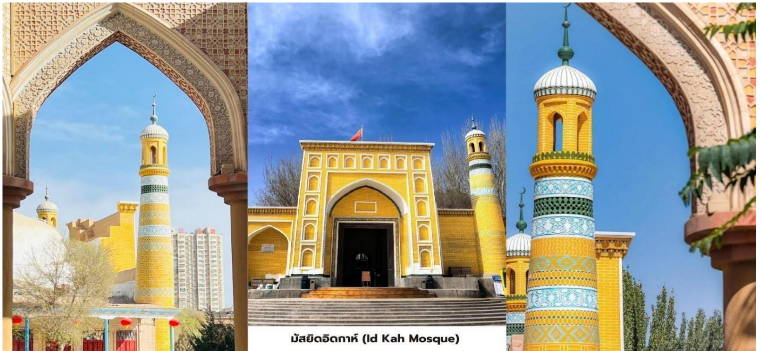
มัสยิดอิตก้าห์ (Id Kah Mosque)

**หมายเหตุสำคัญ** เนื่องจากส่วนหนึ่งของโปรแกรมผ่านเขต Tashkurgan ซึ่งติดชายแดนปากีสถาน และอัฟกานิสถานนักท่องเที่ยวทุกท่านจึงจะต้องมีใบอนุญาตเดินทาง ซึ่งทางทัวร์จะดำเนินการให้