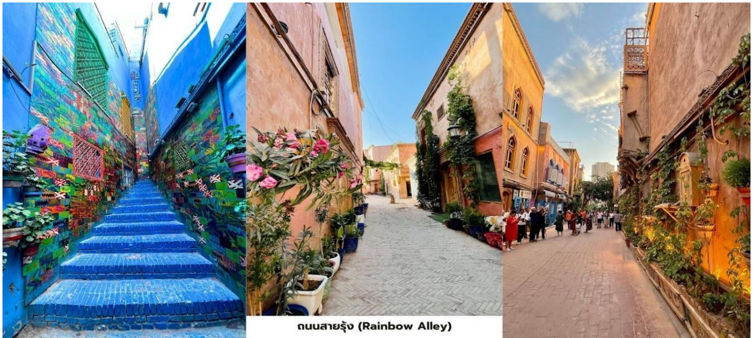
ถนนสายรุ้ง (Rainbow Alley)

นำท่านแวะชม ย่านศิลปะ ที่มีชื่อเสียงของเมืองคัชการในปัจจุบัน ถนนสายรุ้ง (Rainbow Alley / 彩虹巷街) เป็นซอยแคบๆ ที่บ้านเรือนที่ถูกทาสีสดใสหลากหลายสีจนกลายเป็น จุดถ่ายภาพยอดนิยม ที่นักท่องเที่ยวสามารถมาเก็บภาพความสวยงามได้ทุกมุม ถนนภาพวาดน้ำมัน (Oil Painting Street) เป็นย่านแกลเลอรีของศิลปินท้องถิ่นที่จัดแสดงและจำหน่ายภาพวาดเกี่ยวกับภูมิทัศน์และวัฒนธรรมของซินเจียง นอกจากนี้นักท่องเที่ยวยังสามารถเลือกซื้อ ของที่ระลึกและงานหัตถกรรมพื้นเมือง