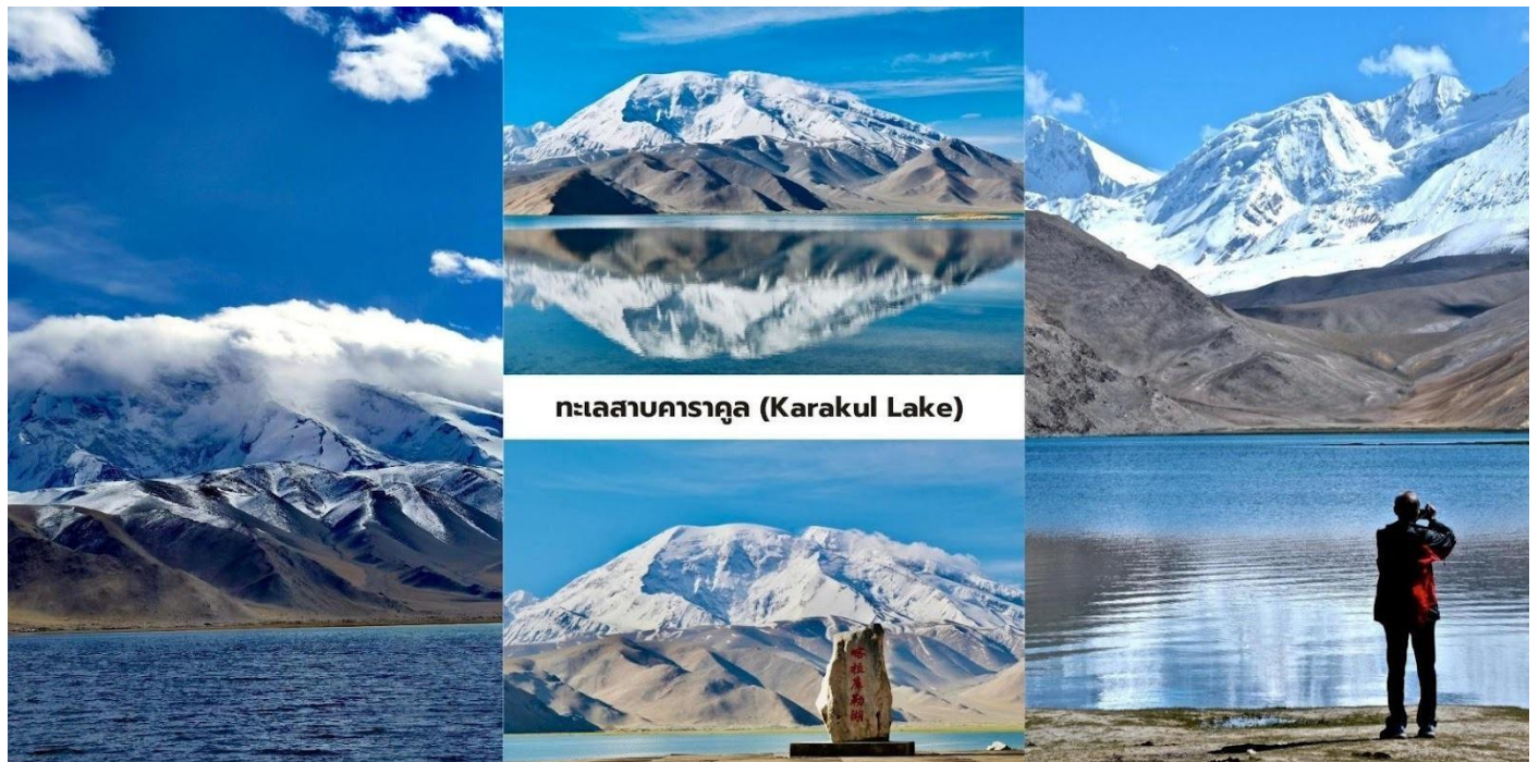
ทะเลสาบคาราคูล (Karakul Lake)

นักท่องเที่ยวสามารถเดินชมทัศนียภาพรอบทะเลสาบและสัมผัสบรรยากาศธรรมชาติของที่ราบสูงปามีร์ที่เจียบสงบ ถือเป็นหนึ่งในจุดชมวิวภูเขาหิมะและทะเลสาบที่สวยงามที่สุดของเส้นทางสายปามีร์