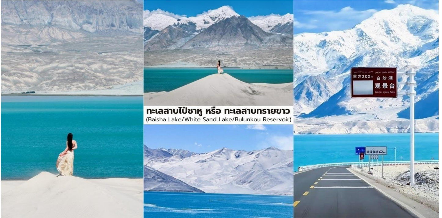
ทะเลสาบไปซาหู หรือ ทะเลสาบทรายขาว (Baisha Lake/White Sand Lake/Bulunkou Reservoir)

บ้าย นำท่านเที่ยวชม ทะเลสาบคาราคูล (Karakul Lake 喀拉库勒湖) ทะเลสาบธารน้ำแข็งขนาดใหญ่ ที่ตั้งอยู่บนความสูงประมาณ 3,600 กว่าเมตรเหนือระดับน้ำทะเล บริเวณเชิงเขา मुखากหรืออาตาคำว่า "คาราคูล" ในภาษาเตอร์ก หมายถึง "ทะเลสาบดำ" แต่ในวันที่อากาศแจ่มใสผืนน้ำของทะเลสาบจะปรากฏเป็น สีน้ำเงินคราม และทำหน้าที่เสมือน กระจกเงารธรรมชาตินขนาดใหญ่ ที่สะท้อนภาพของภูเขาหิมะและท้องฟ้าออกมาอย่างสวยงาม บริเวณรอบทะเลสาบเป็นถิ่นอาศัยของ ชนเผ่าคีร์กีซ ที่อาศัยอยู่ในบ้านแบบ ยูร์ต (Yurt) ซึ่งเป็นที่พักแบบดั้งเดิมของชนเผ่าเร่ร่อนในเอเชียกลาง