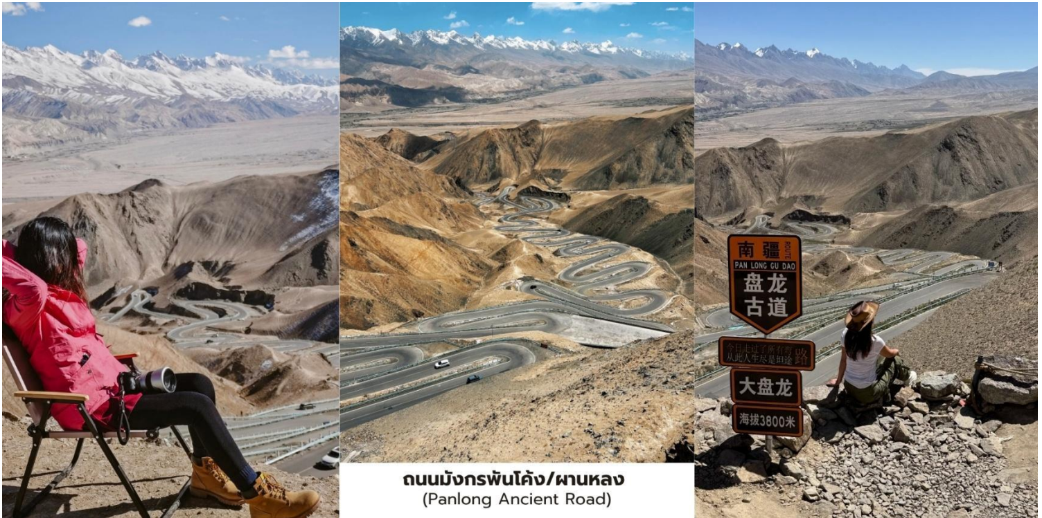
ถนนมังกรพันโค้ง/ผานหลง (Panlong Ancient Road)

ซินเจียงระหว่างการเดินทางท่านจะได้สัมผัสทัศนียภาพของภูเขาหิมะแห่งเทือกเขาปามีร์และภูมิประเทศแบบที่ราบสูงอันกว้างใหญ่ถนนที่ทอดตัวขึ้นลงตามสันเขาทำให้เกิดมุมมองที่สวยงามและน่าตื่นตาตื่นใจเหมาะสำหรับการชมวิวและถ่ายภาพ