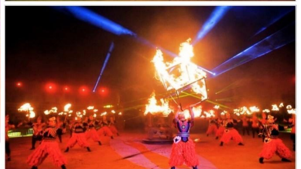
งานราตรีรอบกองไฟมองโกเลีย