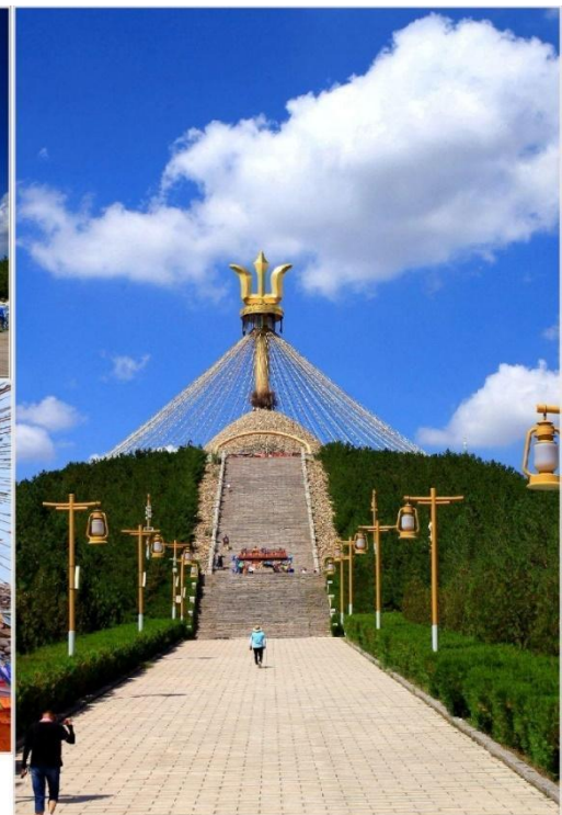
อี้เค่อโอบ้อ (Great Oboe, 伊克敖包)