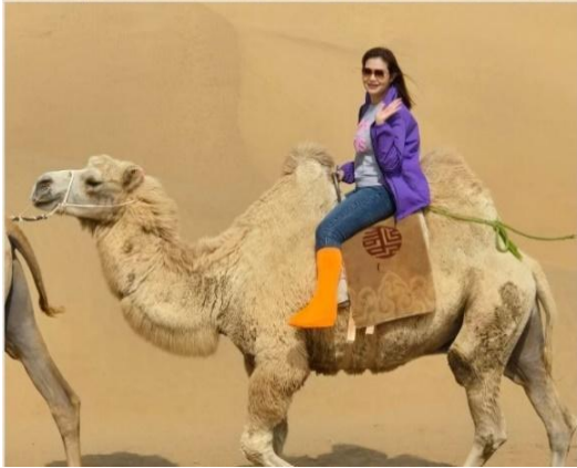
พิเศษ...ขี่อูฐ (รวมค่าขี่อูฐ) สัมพัสประสบการณ์การเดินทางแบบดั้งเดิม