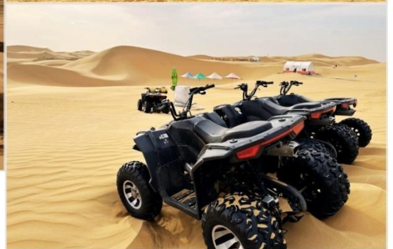
OPTION TOUR เลือกซื้อกิจกรรม สนุกสุดเหวี่ยงในทะเลทราย

นำท่านเดินทางสู่ทุ่งหญ้าออร์ดอส ใช้เวลาเดินทางประมาณ 2 ชั่วโมง ค่า บริการอาหารค่ำ ณ ภัตตาคาร