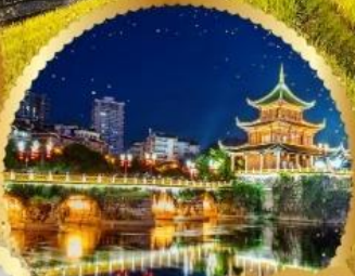
ตึกเซียวเฮยา