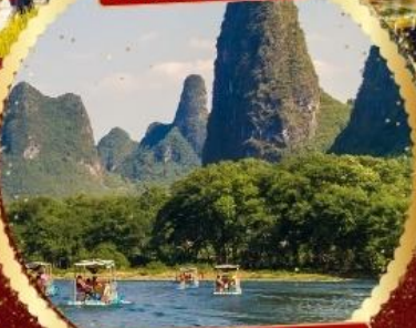
ล่องแพแม่น้ำหลีเจียง