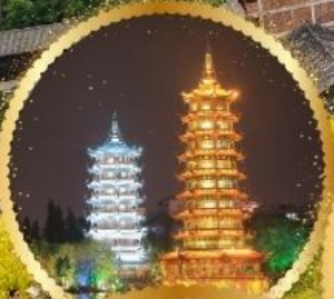
เจดีย์เงิน เจดีย์ทอง