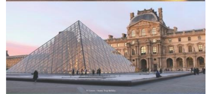
LOUVRE MUSEUM พิพิธภัณฑ์ลูฟวร์