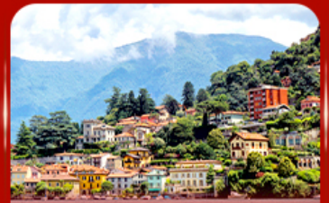
ชนวิวดสวย ทะเลสาบโคโม