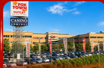
ฟ็อกซ์ทาวน์ ไอทาลี