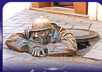
รูปปั้นคูมิล บราติสลาวา