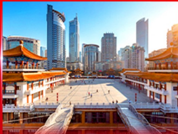
เซ็คคิน ตักคิ้วชิ่งโหว

OPTION ชิตักว๋องชิ่ง ซบพพงงงง, POPMART, ซือเป็งงงง, ดงนงงงงง