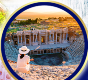
นครเฮียราโพลิส