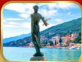
ราชินีแห่งอาเดรียติก โอฟาเทีย