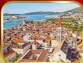
มหาวิหารเซนต์ลอว์เรนซ์