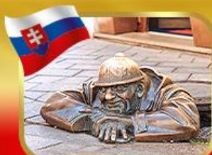
เข็ชอินคู้คูมิลเมืองบาสึลาวา