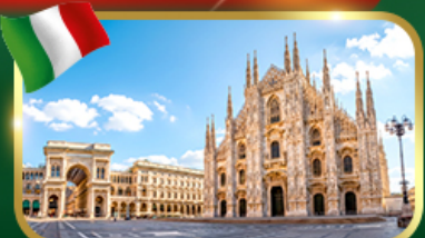
เช็คอิน มหาวิหารดูโอโมแห่งมิลาโน