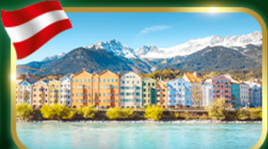
อินส์บรุค เมืองสวยเทือกเขาแอลป์