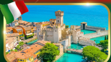
เมืองสวยริมทะเลสาบ เซอร์มियोเน่