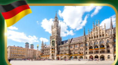
เช็คอิน จัตุรัสมาเรียนพลัทซ์