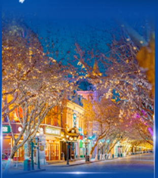
ย่านจงหยาง สตรีท