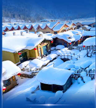
หมู่บ้านหิมะ สโนว์ทาวน์