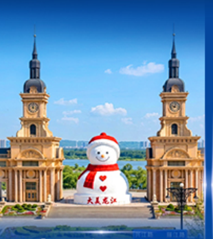
ตุ๊กตาหิมะยักษ์ ฮาร์บิน