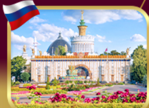
สวนสาธารณะ VDNKH