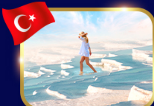
ปราสาทปุยฝ้าย ปามุคคาเล่