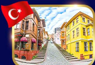
ชมบ้านหลากสี ย่านบาลิก