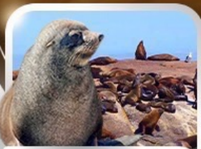
ล่องเรือชมฝูงแมวน้ำ ru Seal Island

ตะลุยซาฟารี อุทยานสัตว์ป่าหุบเขาพิลานเนเบิร์ก