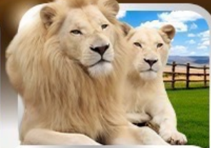
เข้าชมสวนเสือแบงโกลิซิด The Lion Park