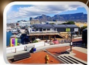
ช้อปปิ้งท่าเรือแบรนด์ชั้นนำ V&A waterfront