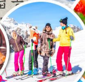
เล่นสกีจุใจ