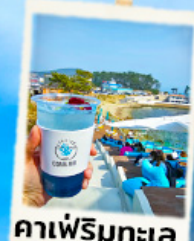
คาเฟ่ริมทะเล