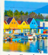
ท่าเรือสีสัน