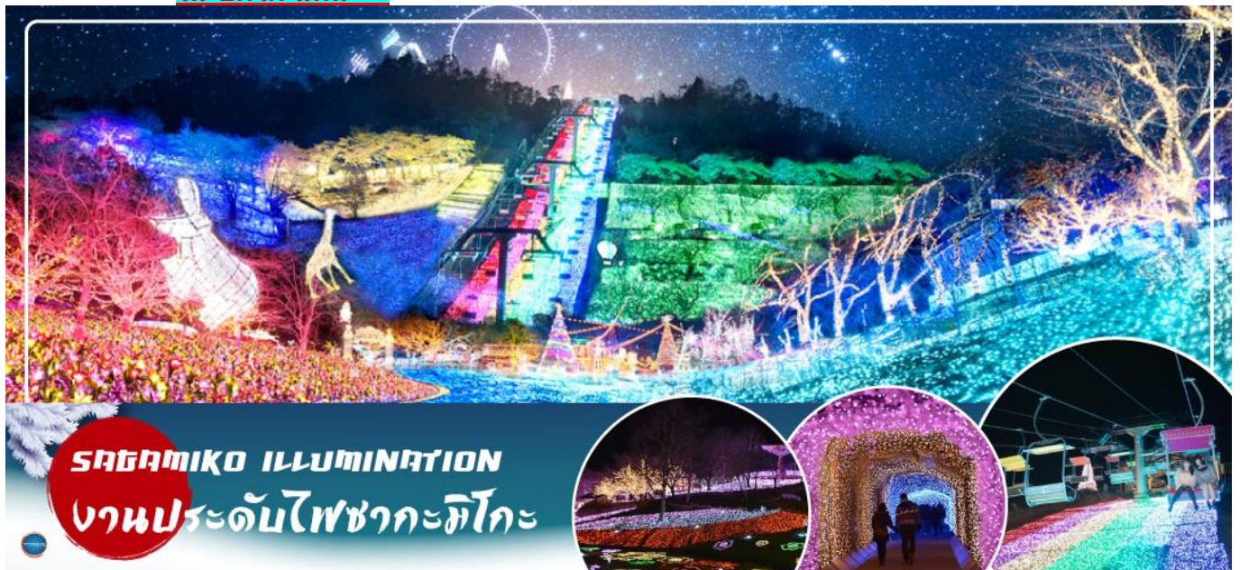
SAGAMIKO ILLUMINATION งานประดับไฟซากะมิโกะ

** ปกติงานประดับไฟซากะมิโกะ จะปิดทำการทุกวันพุธและพฤหัสบดี อังอิงจากงานประดับไฟของปี 2023 - 2024 กรณีที่กรุ๊ปเดินทางเข้าชมตรงวันหยุดของงานประดับไฟซากะมิโกะ ขอปรับเปลี่ยนโปรแกรมเป็น งานประดับไฟที่หมู่บ้านเยอรมัน (Tokyo german village) หลนแทนในวันถัดไป และที่เที่ยววันนี้จะเป็น หมู่บ้านไอชิโนะฮักโก แทน **