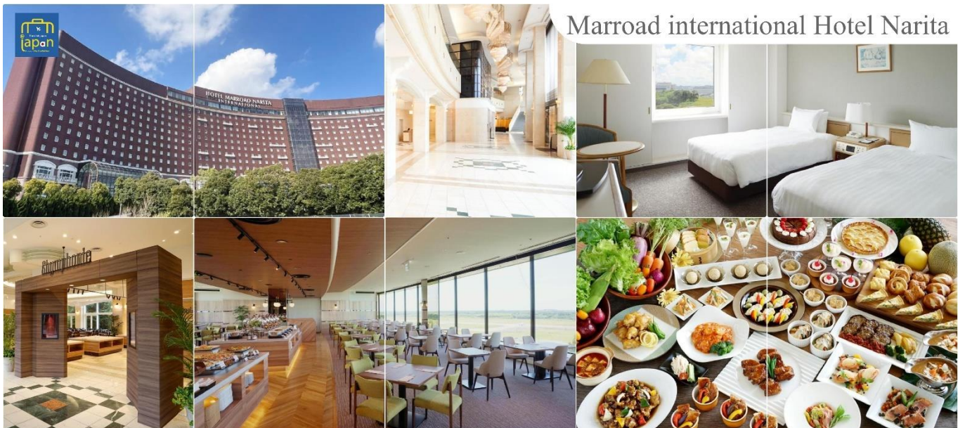
Marroad international Hotel Narita

MARROAD INTERNATIONAL HOTEL NARITA หรือเทียบเท่าระดับเดียวกัน