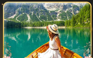
พายเรือทะเลสาบ Braies