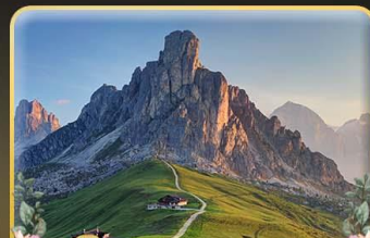
เยือน Passo Giau