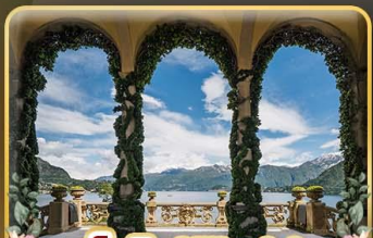
เชคอิน Villa del Balbianello

ที่สุดของธรรมชาติแห่งอิตาลี ทิวเขา ทะเลสาบ ความงามแห่งโดโลไมท์