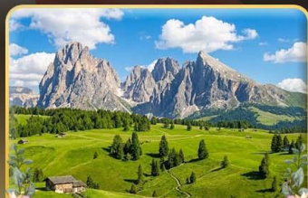
ชมวิวลังการ alpe di siusi