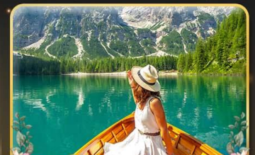
พายเรือทะเลสาบ Braies